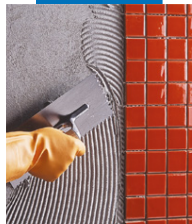
Posa a rivestimento di mosaico ceramico