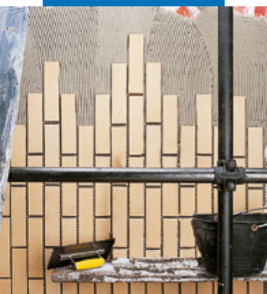
Posa a parete in esterno