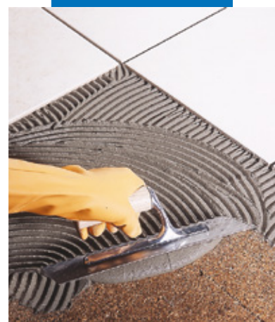
Posa a rivestimento di piastrelle in monocottura su sughero

N.B. I dati tecnici di Kerabond impastato con Isolastic sono riportati sulla scheda tecnica di quest'ultimo.