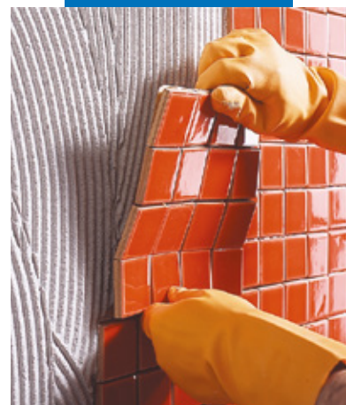
Posa a rivestimento di mosaico ceramico