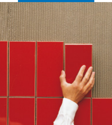
Posa a parete

Le referenze relative a questo prodotto sono disponibili su richiesta e sul sito Mapei www.mapei.it e www.mapei.com